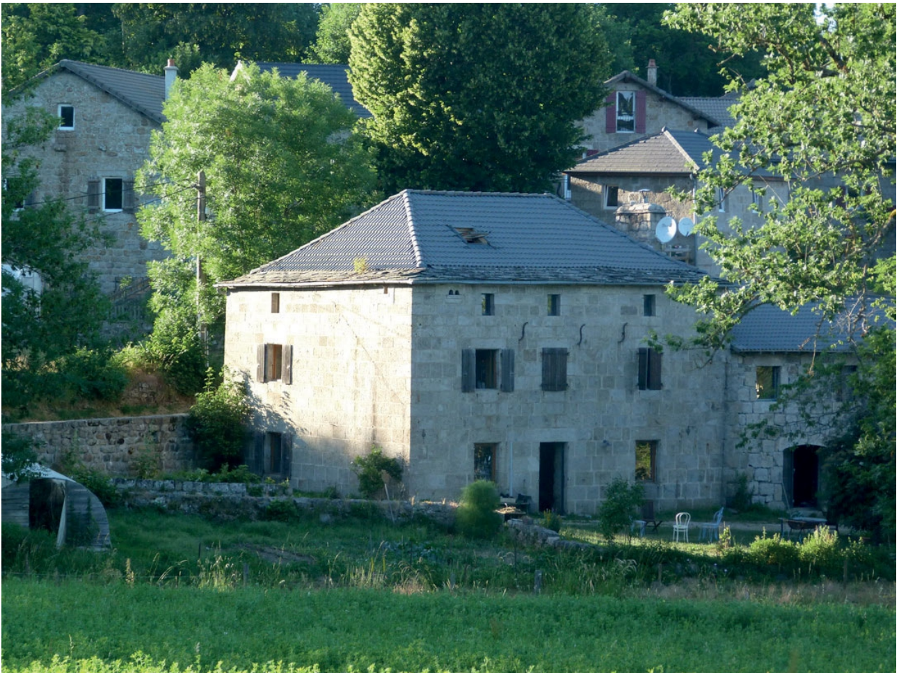
Rez de chaussée, façade sud : la porte d'entrée commune, à gauche la fenêtre de la cuisine de l'instituteur, à droite la cuisine du propriétaire Au premier étage les deux fenêtres de gauche étaient celles de la classe, la troisième à droite éclaire la chambre de l'instituteur