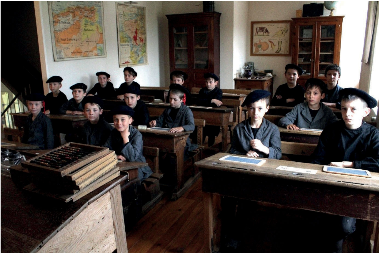
Reconstitution d'une salle de classe à l'ancienne, mais plus tardive, ici, détail qui a son importance, les bancs sont à deux places et ils ont un dossier ! Beaucoup viennent de l'école de Malagayte, le bureau du maître vient des Eyrauds.